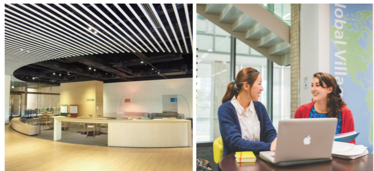
学习共享 ラーニングコモンズ

今出川図書館では約82万冊、京田辺校地のラーネッド記念図書館では約26万冊の蔵書を備えています。マルチメディア資料、各種学術情報データベースへのアクセスなど多彩に利用でき、学生の学習・研究を支えています。